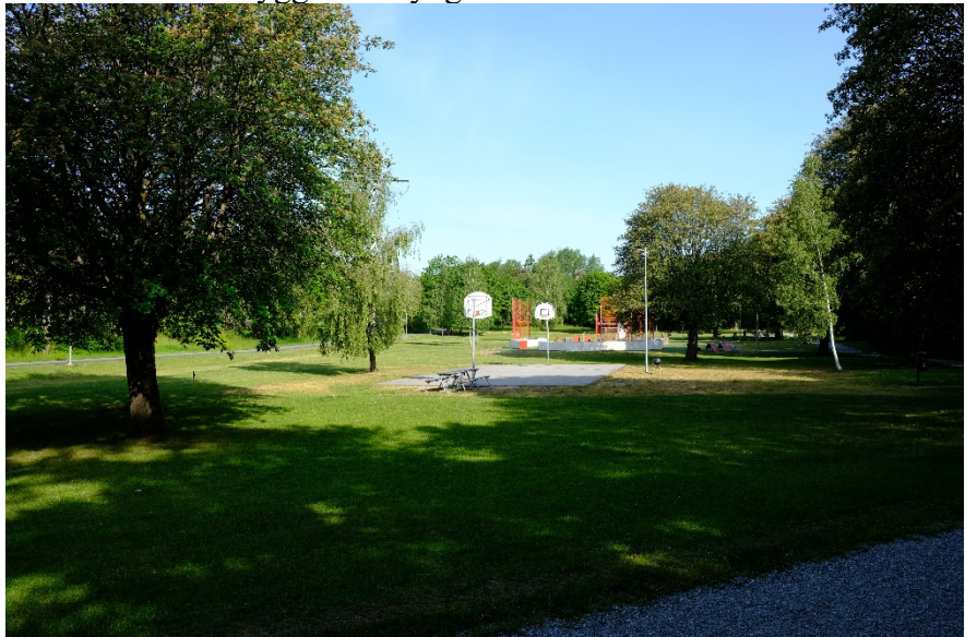
Bild 2. Fotografi taget från parkens sydvästra ände.

Stadsdelsförvaltningen vill däremot förtydliga att spontanidrottsytor är öppna för alla och att det därför inte går att reglera hur de används, som till exempel är möjligt på bokningsbara idrottsytor. Att ungdomar använder stadsdelsområdets parker och anläggningar anser stadsdelsförvaltningen är positivt, men har samtidigt förståelse för att yngre barn kan uppleva känslor som författarna av medborgarförslaget beskriver när de befinner sig på samma platser. Stadsdelsförvaltningen bedömer att blandningen av aktiviteter inom parken skapar förutsättningar för närvaro av vuxna, som kan bidra till en känsla av trygghet för yngre barn som vill vistas där.